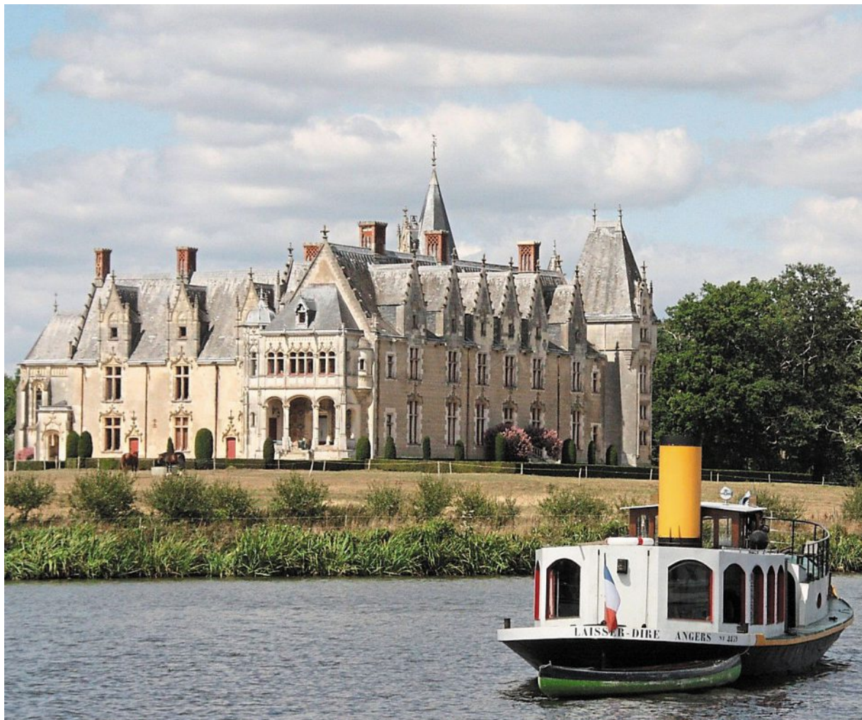
Le sentier longe le château de la Gascherie (XV e et XVI e siècles), merveille architecturale des rives de l'Erdre.

En 1617, la fière demeure échoit à Louis Charette de la Collinière, conseiller au Parlement de Bretagne et élu maire de Nantes en 1650. Entretemps, elle fut habitée par François Lanoue Bras de Fer, né en 1531 à La Gascherie, capitaine huguenot durant les guerres de religion et compagnon du roi François 1 er pendant les